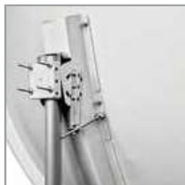
Carpenteria / mounts Ø 125