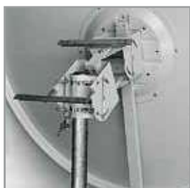
Carpenteria / mounts Ø 150