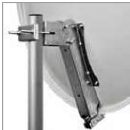
Carpenteria / mounts Ø 80