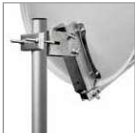
Carpenteria / mounts Ø 60-65