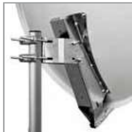
Carpenteria / mounts Ø 85