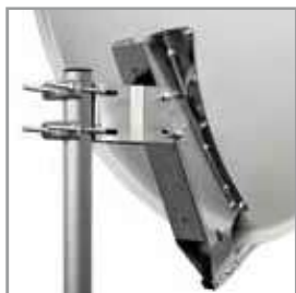
Carpenteria / mounts Ø 100