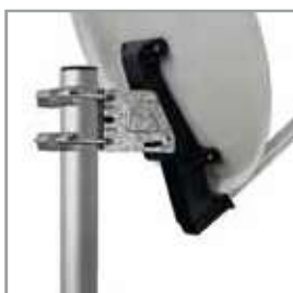
Supporto in polipropilene PP support with fiber glass Ø 45