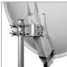
Carpenteria / mounts Ø 115